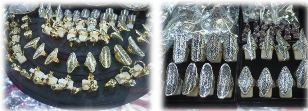
เครื่องถมประเภทถมเงินและถมทอง

ปัจจุบันผู้ประกอบการจังหวัดนครศรีธรรมราชเน้นทำการตลาดภายในประเทศ ผ่านหลายช่องทางจำหน่าย ได้แก่ การวางจำหน่ายทางหน้าร้าน ผ่านช่องทางออนไลน์ งานแสดงสินค้าในประเทศ และขายส่งให้แก่ตัวแทนจำหน่ายที่มารับซื้อแล้วนำไปขายต่ออย่างจังหวัดอื่นๆ ทางภาคใต้ ได้แก่ สงขลา พังงา สุราษฎร์ธานี และภูเก็ต เป็นต้น สำหรับการวางจำหน่ายผ่านทางหน้าร้านพบว่าลูกค้าเป้าหมายมีทั้งคนในพื้นที่ นักสะสม และนักท่องเที่ยวที่แวะเวียนมาเลือกชมและซื้อสินค้าโดยตรง ซึ่งผู้ประกอบการหลายรายมักส่งเสริมการขายโดยการให้ส่วนลดแก่ลูกค้า และเน้นสร้างบรรยากาศการซื้อขายที่เป็นกันเองเพื่อให้สามารถจำหน่ายสินค้าออกไปได้