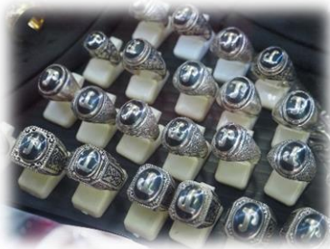
แหวนหัวมะโม